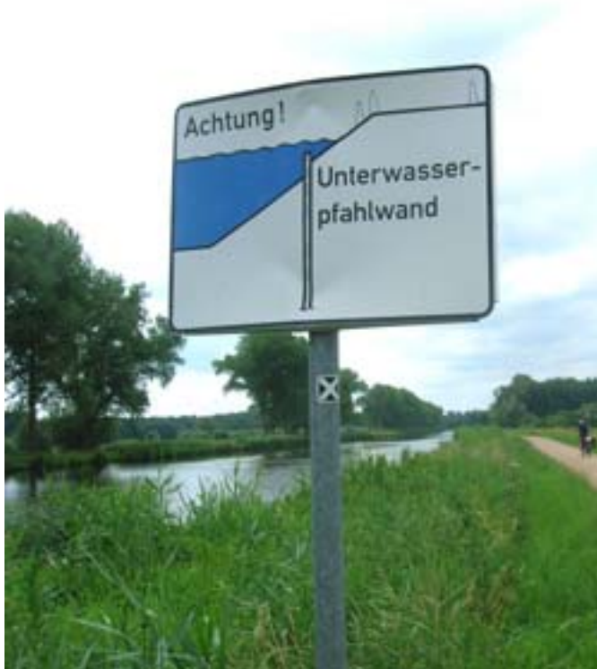
Vooroever op Lübeck-Elbe-kanaal

Het idee om een vooroever aan te brengen is volgens ons de beste en meest haalbare manier om voor een lint van groen aan weerszijden van de Coupure te zorgen. De techniek om damplanken in het water te heien kent ook op andere plaatsen succes. Onderstaand voorbeelden uit Drongen en Duitsland.