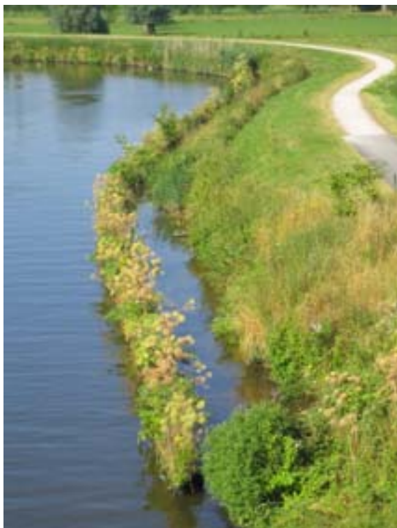
Vooroever langs de Leie in Drongen