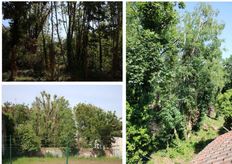
afbeelding 1: beelden van het akkerbosje

Een projectontwikkelaar wil een aantal meergezinswoningen bouwen met parkeerkelder in de Akkerstraat. Het bouwperceel, een bos met hoge natuurwaarde, is echter opgenomen in RUP Groen dat in 2019 als voorontwerp werd aangenomen. Het bosje is op de biologische waarderingskaart opgenomen als park. Volgens het het nog goed te keuren RUP Groen is dit dus verboden te wijzigen, als een onderdeel van het fijnmazig groen netwerk en verweven groenstructuur in gesloten bebouwd landschap van kern- en binnenstad.